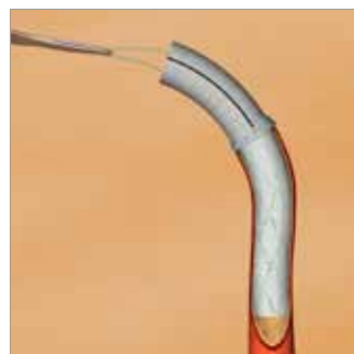
Estrazione della cuffia chirurgica