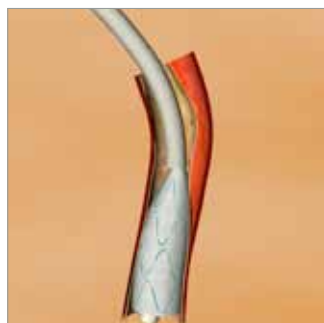
Rilascio dell' Endoprotesi