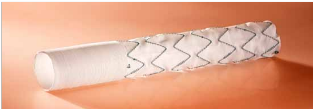
Il sistema ibrido E-vita open plus